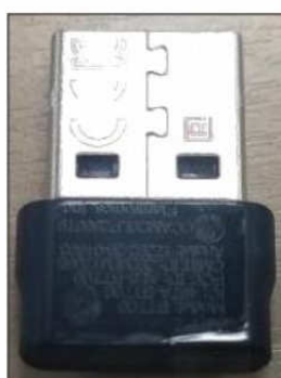
Figura 3 – Adaptador Bluetooth