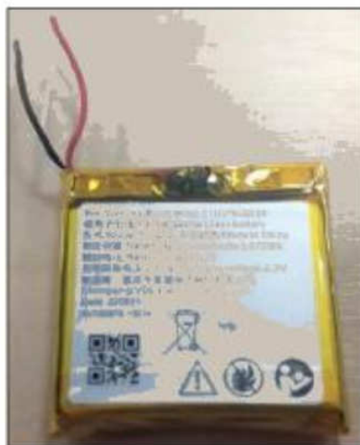
Figura 5 – Bateria