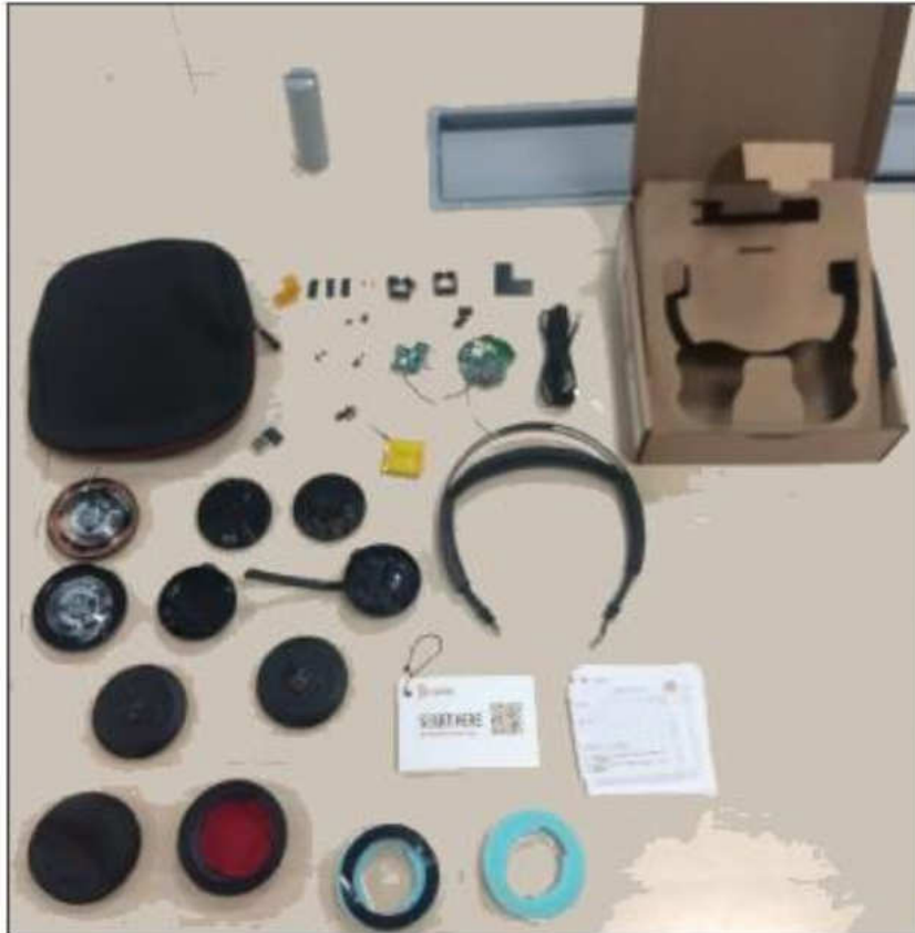
Figura 6 – Foto de todas as partes que integram o produto