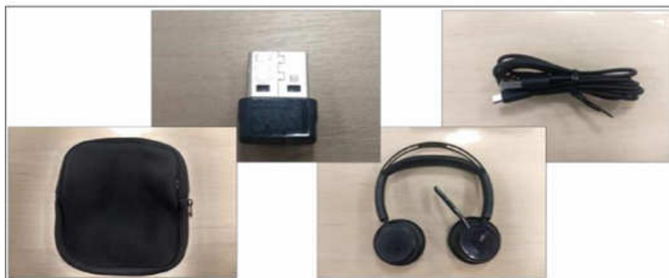
Figura 2 – Todos os itens que vem junto com o fone de ouvido