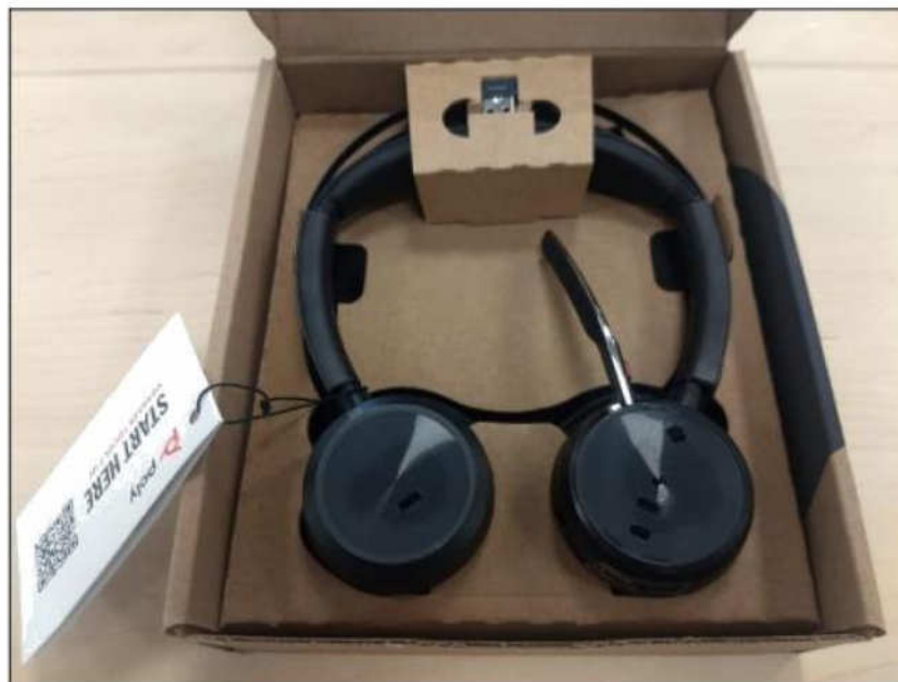
Figura 7 – Foto do produto dentro de sua embalagem