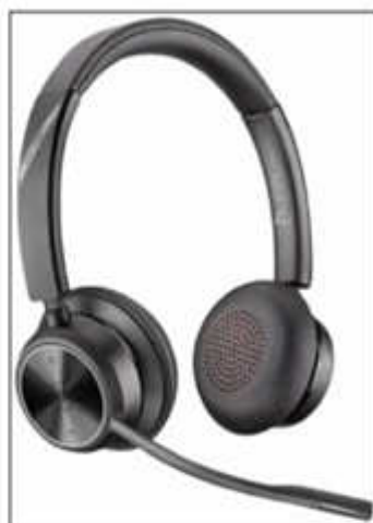
Figura 1 – Imagem nítida do fone de ouvido sem fio