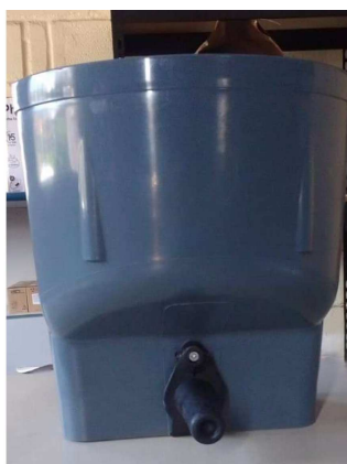
Balde completo, com um bico para alimentação