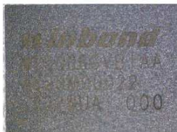
Circuito integrado memória Flash